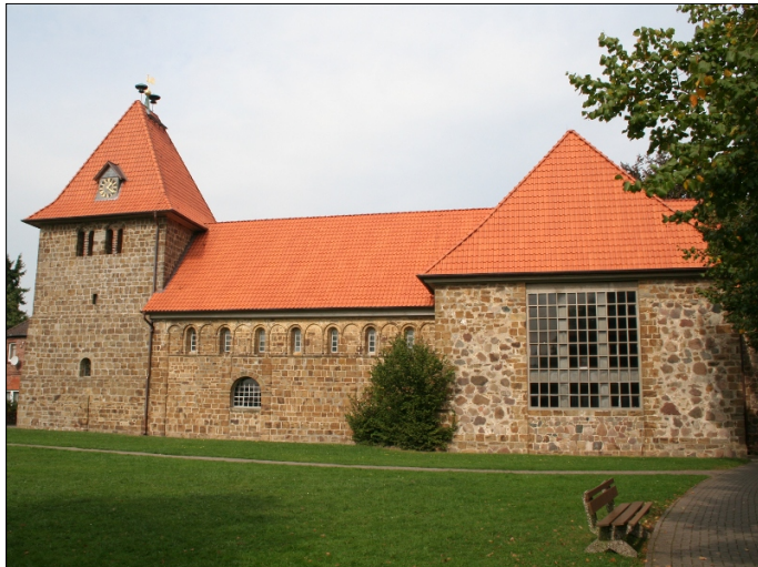
Kirche in Wietzen